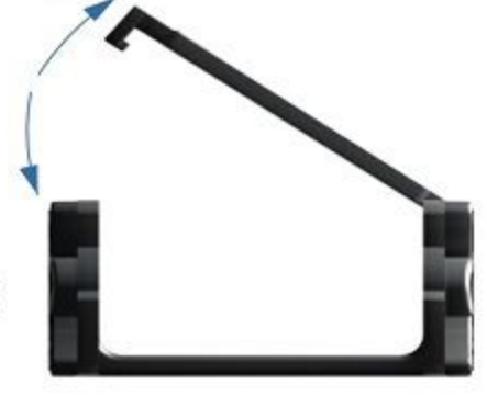
S20 A TİPİ

PA 6 %30 Fiber Glass Prime Operating Temperature (-30 °C +130 °C)